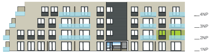
Západní pohled na dům / Building View - west side