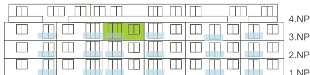
Západní pohled na dům/ Building View - West side