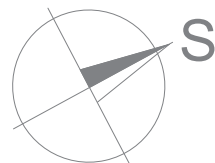
Půdorys podlaží/ Floor plan