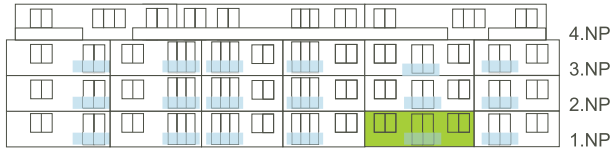
Západní pohled na dům/ Building View - West side