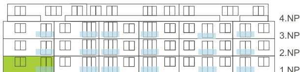
Západní pohled na dům/ Building View - West side