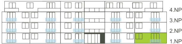
Východní pohled na dům/ Building View - East side