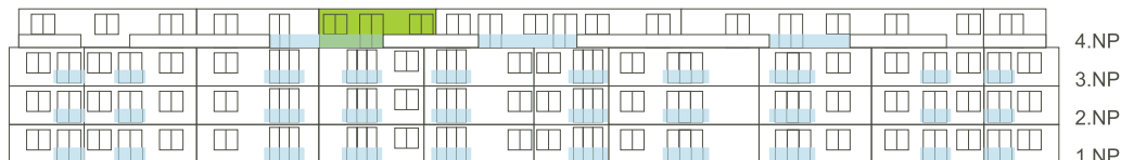
Západní pohled na dům/ Building View - West side