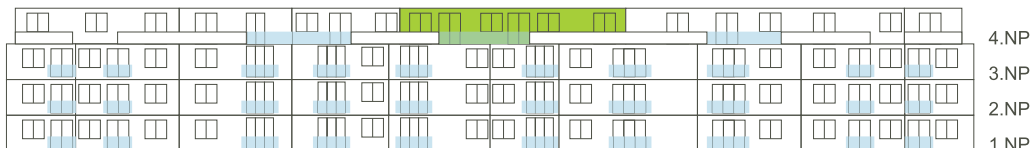
Západní pohled na dům/ Building View - West side