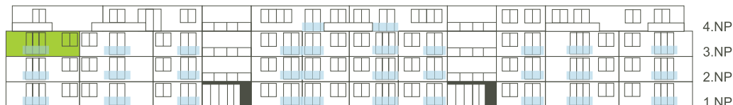
Východní pohled na dům/ Building View - East side