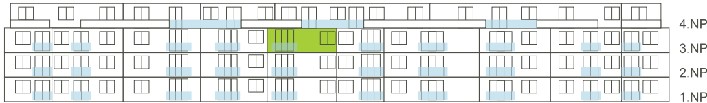
Západní pohled na dům/ Building View - West side