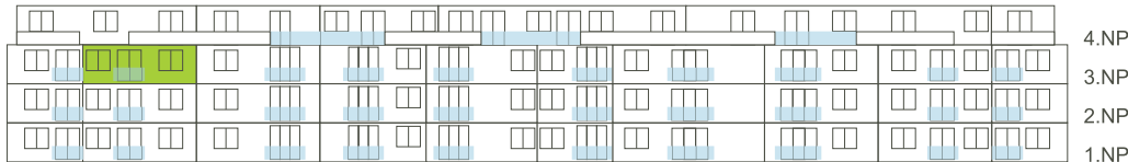
Západní pohled na dům/ Building View - West side