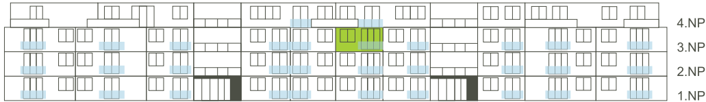
Východní pohled na dům/ Building View - East side