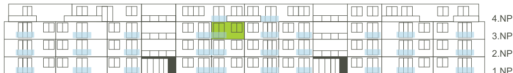
Východní pohled na dům/ Building View - East side