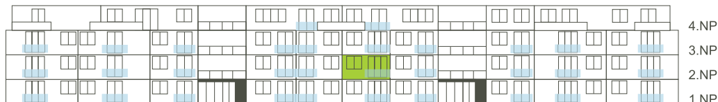
Východní pohled na dům/ Building View - East side