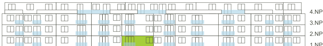
Západní pohled na dům/ Building View - West side