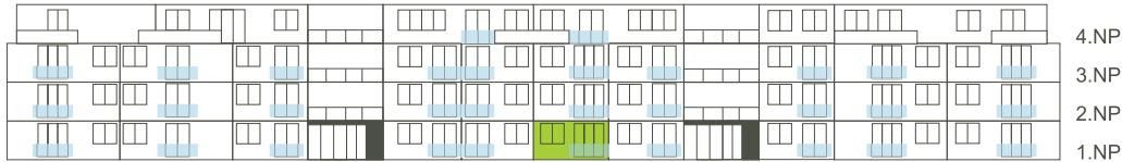
Východní pohled na dům/ Building View - East side